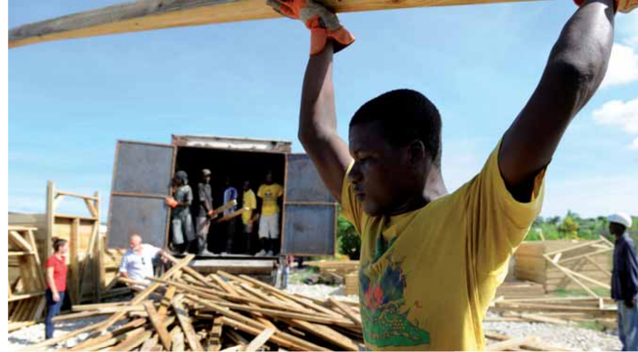
Preparación de materiales para la construcción de un albergue temporal.

En la UTR Distrito Central destaca la poca capacidad de las instituciones y la centralización en la toma de decisiones. En la UTR Valle de Ángeles se considera muy deficiente la participación de la población y los distintos sectores de la sociedad en las acciones de desarrollo local y RRD.