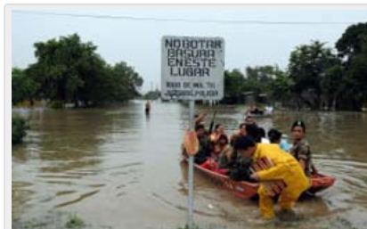
"En menos de 20 años casi todos los países del mundo tendrán una vulnerabilidad 'alta' en al menos un sector, a medida que el planeta se calienta", asevera el informe.

En efecto, de acuerdo con los datos del reporte, el 80% de todas las muertes atribuidas al cambio