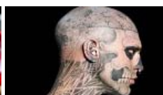
Un modelo particular