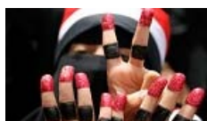
Jóvenes y libres